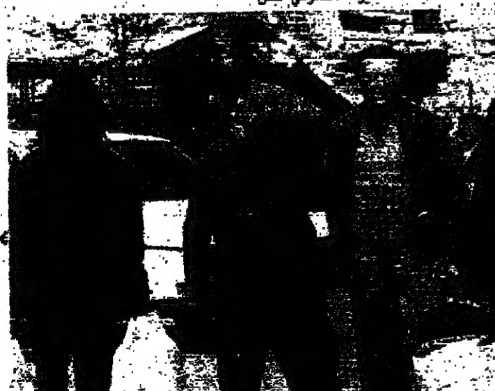
مكتبة الصالون اس